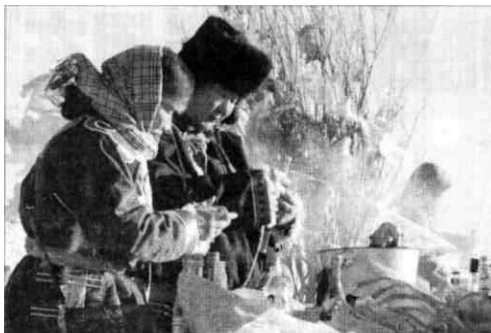
12月21日,鄂温克族群众在敖包前进行祭祀活动。当日,第四届鄂温克族冰雪那达慕大会在内蒙古鄂温克族自治旗开幕。近年来,居住在北疆呼伦贝尔草原上的鄂温克族群众将传统的祭祀敖包活动拓展为冰雪那达慕大会,在雪地上进行赛马、博克、骆驼拉雪橇等表演,吸引了大批来自各地的游客,极大促进了当地的经济。

第六,确保电网的安全稳定运行。两大电网公司和各发电企业要切实履行好电力安全责任,电监会要做好电力安全的监督检查工作。加快区域电网建设,提高输电能力和安全保障水平。