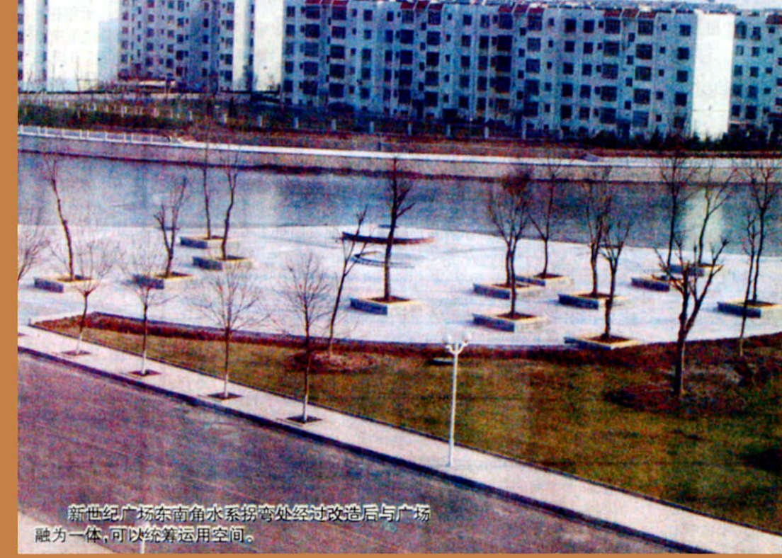
新世纪广场东南角水系拐角处经过改造后与广场融为一体，可以统筹运用空间。

本报讯 近日，记者从市政园林部门获悉，备受市民关注的东城环水系改造施工任务已经全部完成。该工程历时149天，投资2000万元，由市政局负责组织施工，将水系改造成了景观丰富的开放式、敞开式环城公园。 东城水系是我市重要的环境工程和城市基础设施，始建于1993年，竣工于1997年，全长12.99公里，其主要功能是改善城市生态环境，并起到城区防洪排涝作用。近年来，随着我市城市建设步伐的加快，有关部门加大了对水系的改造力度。使水系逐渐走向公园化、景观化，周围设施也更趋人性化、实用化。根据有关部门规划设计，水系改造建设主要包括水滚循环、水质改善，绿化改造，配套功能完善及园林景观建设三个方面。 在整个改造工程中，充分运用各种景观布置手法，建设和创造丰富的园林景观。建设亲水平台5处，完成景亭、景廊、膜结构等景观小品及喷泉、儿童脚踏车、戏水喷泉、假山跌水等水质景观和游船码头、公厕及无障碍设计等配套设施建设。完成铺装3.3万平方米，栏杆2616米。此次改造采用丰富多样的铺装材料，利用灯光、音响监控、雕塑等现代化的手法，创造了丰富的动态景观序列，充分体现了水文化和东营文化，结合植物配置，形成独特的东营水系景观，同时也使水系功能更加系统化和多元化。 (薄文军 高卫斌 武英梅)