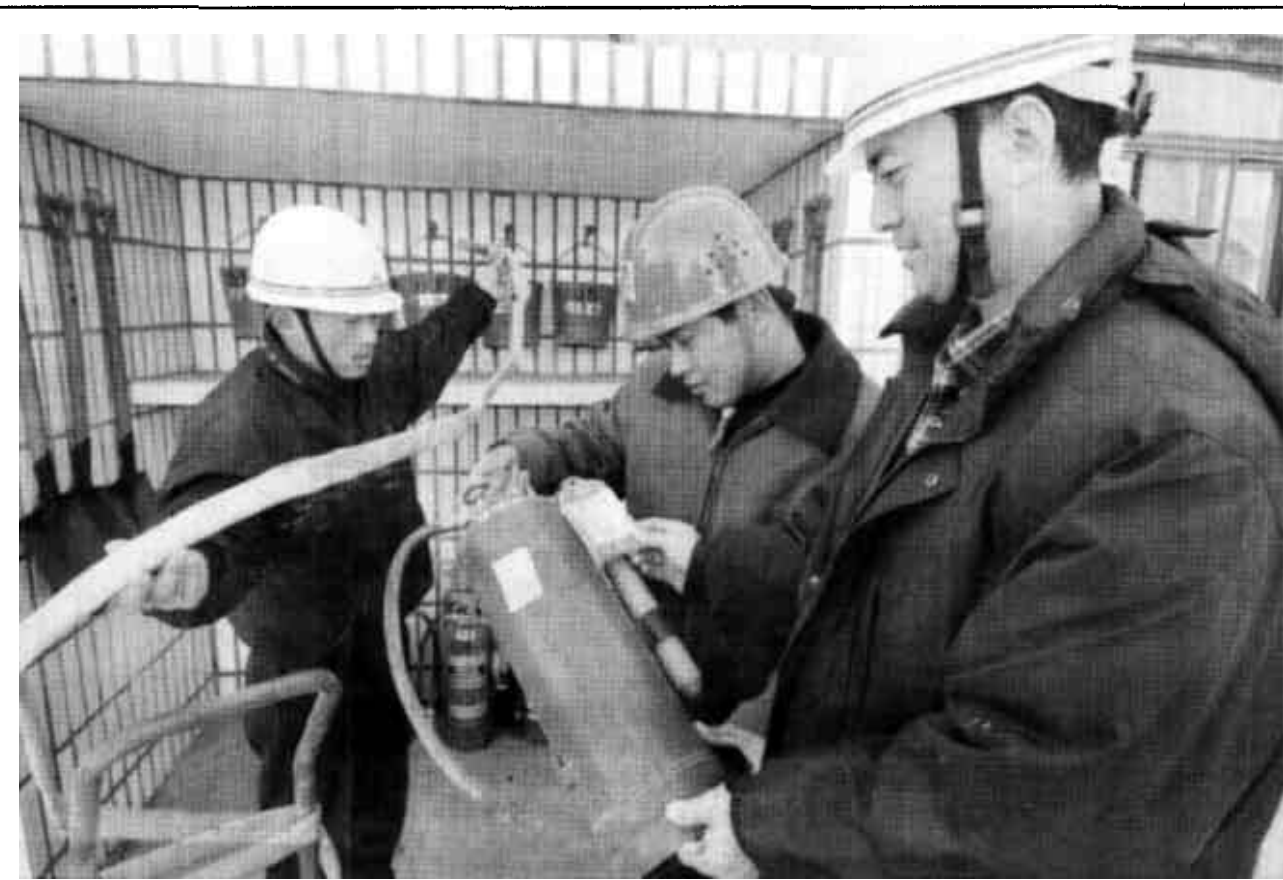
元旦、春节两大节日即将来临之际，垦利县黄河口供电公司认真做好防火、防冰冻为主要内容的安全生产工作，确保节日期间供电安全。图为工作人员正在认真检查消防设备。

为了鼓励群众发展蔬菜生产，这个村专门对地块进行了规划，实施路渠配套，发展区域种植，并制定三年免承包费、免费供应种子等一系列的优惠政策，另外，他们还针对个别困难户进行资金扶持。目前，全村蔬菜“小拱棚”已发展到260个，菜田面积已达230亩，人均0.65亩，仅此一项人均增收820元。(新光 淑霞 景涛)